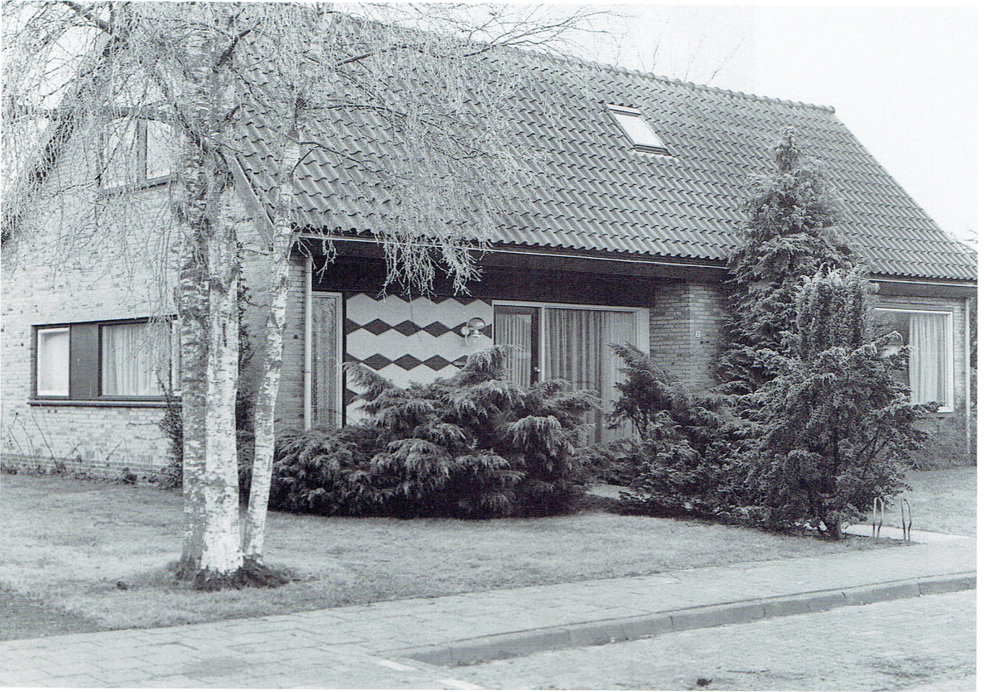
De pastorie aan de Herman Buismanlaan.