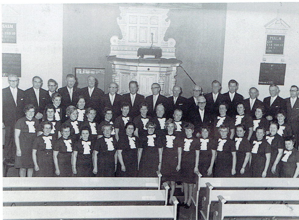
Het Gereformeerd Kerkkoor.