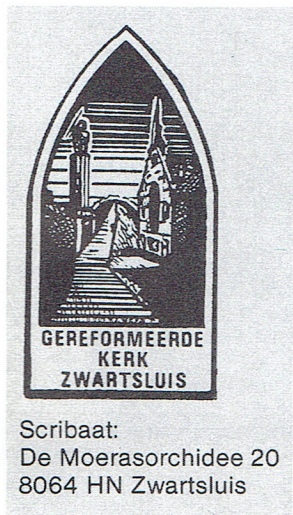
Het oude en het nieuwe kerkze-gel.