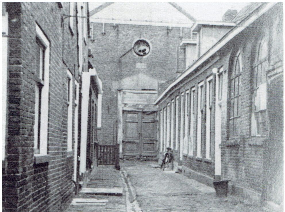
Het kerkje gezien vanuit de steeg. Rechts-vooraan de Christelijke School.