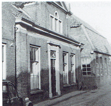
De Chr. Geref. Pastorie in de Nieuwe Sluis.