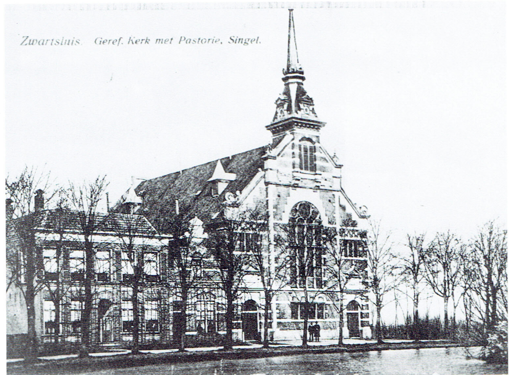
De Cingelse Kerk in 1896.

Na de vereniging van beide kerken en de ingebruikneming van het nieuwe gebouw brak een periode van stabilisatie aan. De maatschappelijke ontwikkeling en de toenemende invloed van de kleine luiden spiegelen zich ook af in de discussies en besluiten van de kerkeraad. Gediscussieerd werd er en niet weinig! Telkenmale bericht ons de scriba over “breedvoerige discussie, ampele besprekingen”. Men ging nooit over één nacht ijs en de vergaderingen liepen soms zo uit dat bepaalde onderwerpen tot een volgende bijeenkomst werden uitgesteld “wegens het vergevorderde uur”. Tenslotte werd het zo bar dat er een voorstel gedaan werd [in juni 1903] de vergaderingen om 10 uur te sluiten. Men bedenke dat de meeste kerkeraadsliden ’s morgens weer vroeg uit de veren moesten, hetgeen ook als argument werd aangevoerd. Hoe lang men dit heeft volgehouden weten we niet. Het zal er wel mee gegaan zijn als met zovele besluiten: na verloop van tijd raakten ze in ’t vergeetboek.