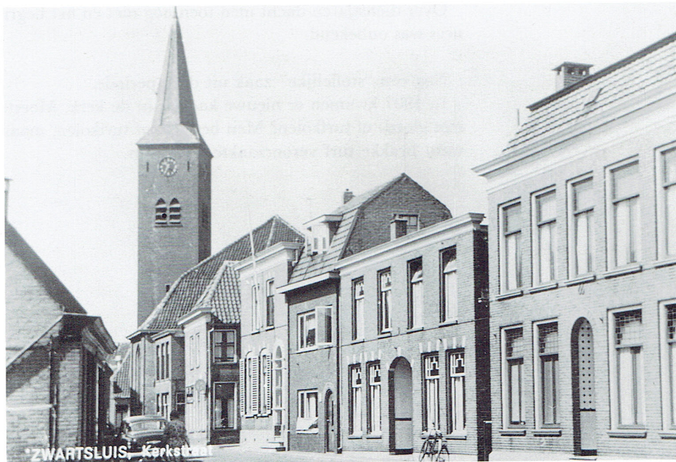
De Gereformeerde Pastorie in de Kerkstraat.

In 1907 kwam men voor een geheel nieuw probleem te staan. In Belt-Schutsloot werd de behoefte gevoeld aan een vergaderlokaal. De Beltigers hadden zelf reeds een aardig bedrag bijeen gebracht [f. 367,50]. De bouwkosten, geschat op f 1700,-, werden op advies van de classis door een lening gefinancierd.