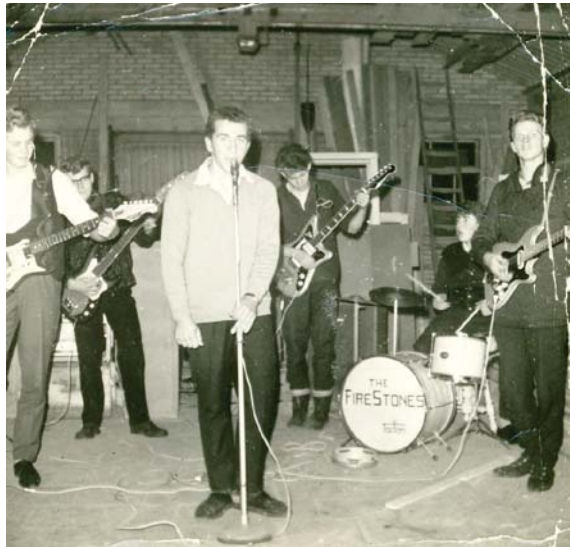
| Repeteren in de werkplaats