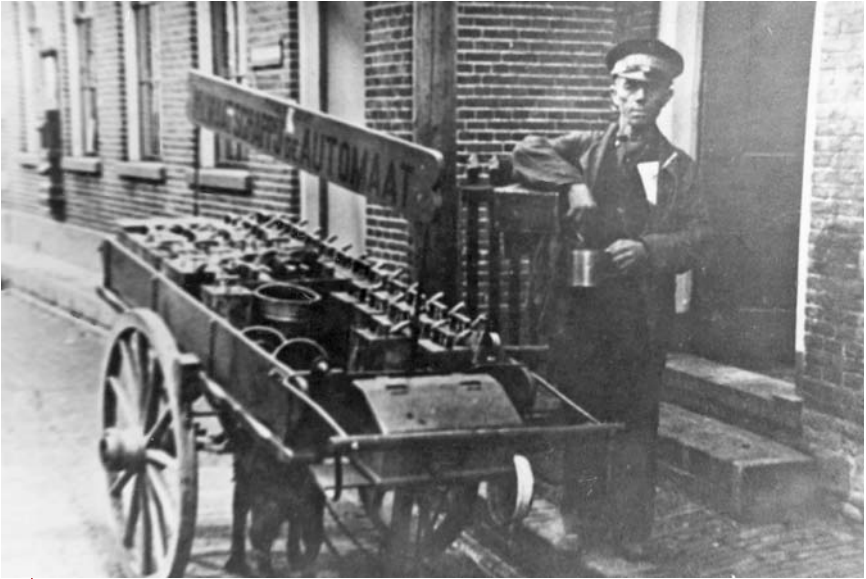
| De handkar met trekhond

Een prachtige foto waar duidelijk de trekhond te zien is, die het verplaatsen van de handkar moet ondersteunen. Het witte email drinkbakje is goed te onderscheiden aan de rechterkant.