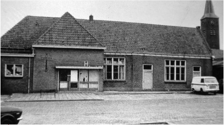
1e optreden Firestones Zwartzluis - in oude Nutsgebouw aan de Schoolstraat

gevuld met vier van deze speakers, die Wim zodanig schakelde dat er een mooi vol geluid uitkwam. Wijcher, van beroep stoffeerder, bekleedde de boxen met skai (een soort kunstleer), bracht metalen anti-stoothoeken aan en zorgde voor een mooi afstekend frontdoek. Toen ze klaar waren lijmdde hij de merknaam "VOX" op het frontdoek. (Zie de foto's van deze boxen verder op de website). Ook werd er gelijktijdig een echo-apparaat gekocht voor de zang en de gitaristen. Naast de gitaren en de zang speelde de basgitaar ook over zo'n box. Voor aparte basspeakers en een specifieke basversterker was op dat moment geen geld meer. Het beleid was dat er niet op de pof gekocht werd. In de beginperiode droegen de bandleden tijdens de optredens gele jasjes met blauwe revers. Deze waren kosteloos gemaakt door Lammert van Dijk, de kleermaker uit Zwartzluis, toen de a.s. schoonvader van manager Helmich Heutink. De eerste sponsor van de band. De officiële foto van de band werd gemaakt door Jaap Jalink en het drukwerk voor de public relations werd verzorgd door boekhandel Driessen en drukkerij Kuipers.