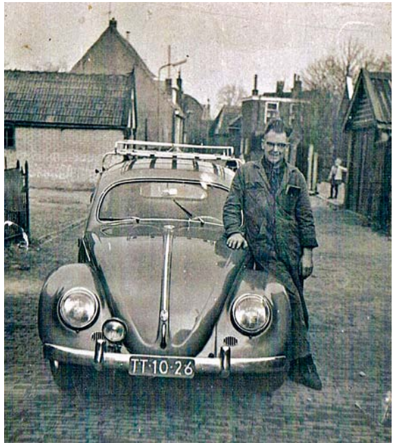
Onze Volkswagen met het nummerbord TT-10-26