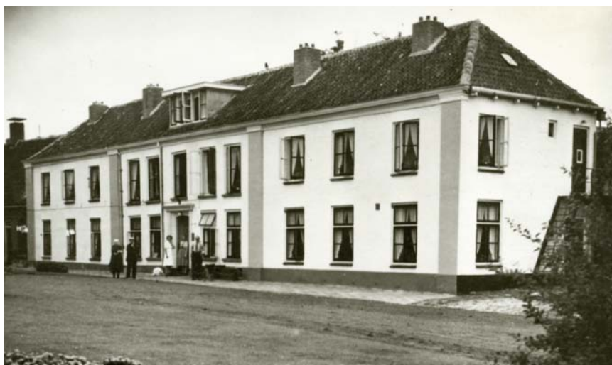
| Armen en weeshuis