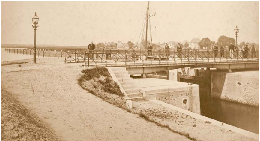
Prachtige foto van de nieuwe Schutsluis, ca. 1880.