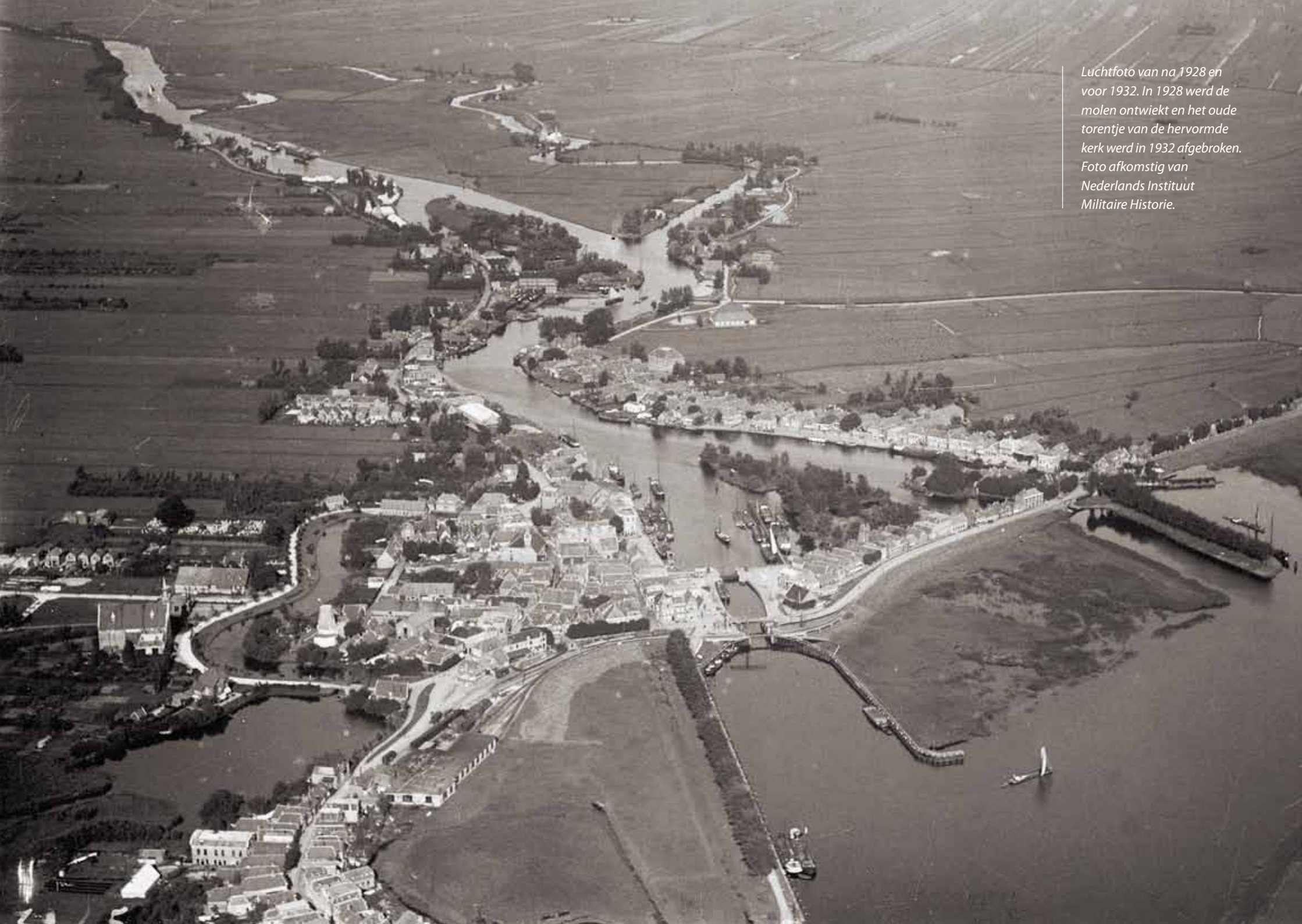
Luchtfoto van na 1928 en voor 1932. In 1928 werd de molen ontwiekt en het oude torentje van de hervormde kerk werd in 1932 afgebroken.