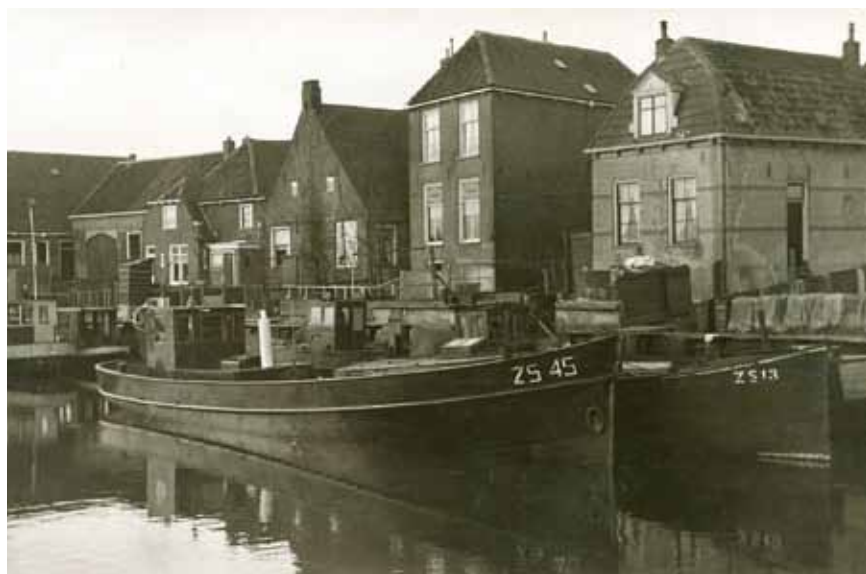
De stalen kotters ZS 45 en ZS 13.

Later werd gevist met de stalen kotter (ZS 16). Die had een 38 PK Kromhout gloeikop. Eerst moest met een brander de kop van de motor warm worden gemaakt en dan moest hij aangeslagen worden. Dat gebeurde door een stang in een groot wiel te zetten en een slinger eraan geven. Je moest dan maar hopen dat hij goed aansloeg en niet in de achteruit. Mijn vader durfde dat niet dus daar was zijn 'knecht' voor (mijn broer Jacob, maar ook zijn andere (latere) knechten, zoals Möppien uit Genemuiden).