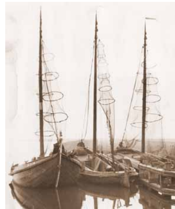
De bottervloot van Zwartsluis op het Zwartewater. Vlnr de ZS 16, ZS 13 en ZS 5.

Naschrift redactie: In het tijdschrift Tagrijn van de Vereniging Botterbehoud (twee nummers uit 1976, nr. 1 en 3) staat een zeer uitgebreid interview met Hendrikus Moorman. Dit interview omvat enorm veel informatie over de visserij in en om Zwartsluis. Te zijner tijd zetten we deze tijdschriften op onze nieuwe website.