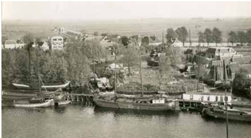
De “turfeilanden”, een driehoekig eiland tussen het Zwartewater en het Meppelerdiep