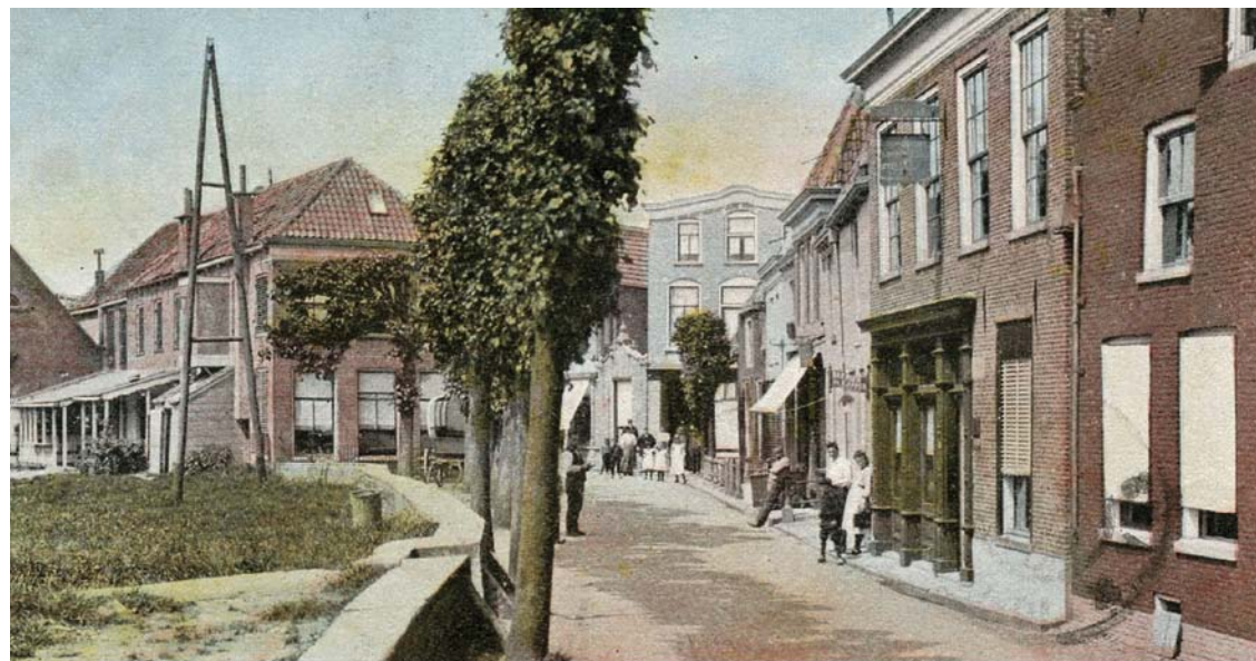
De Stationsweg met duidelijk zichtbaar de waterkeringsmuur