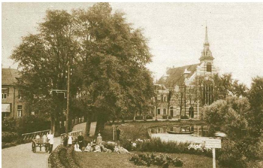
Het Singel omstreeks 1930