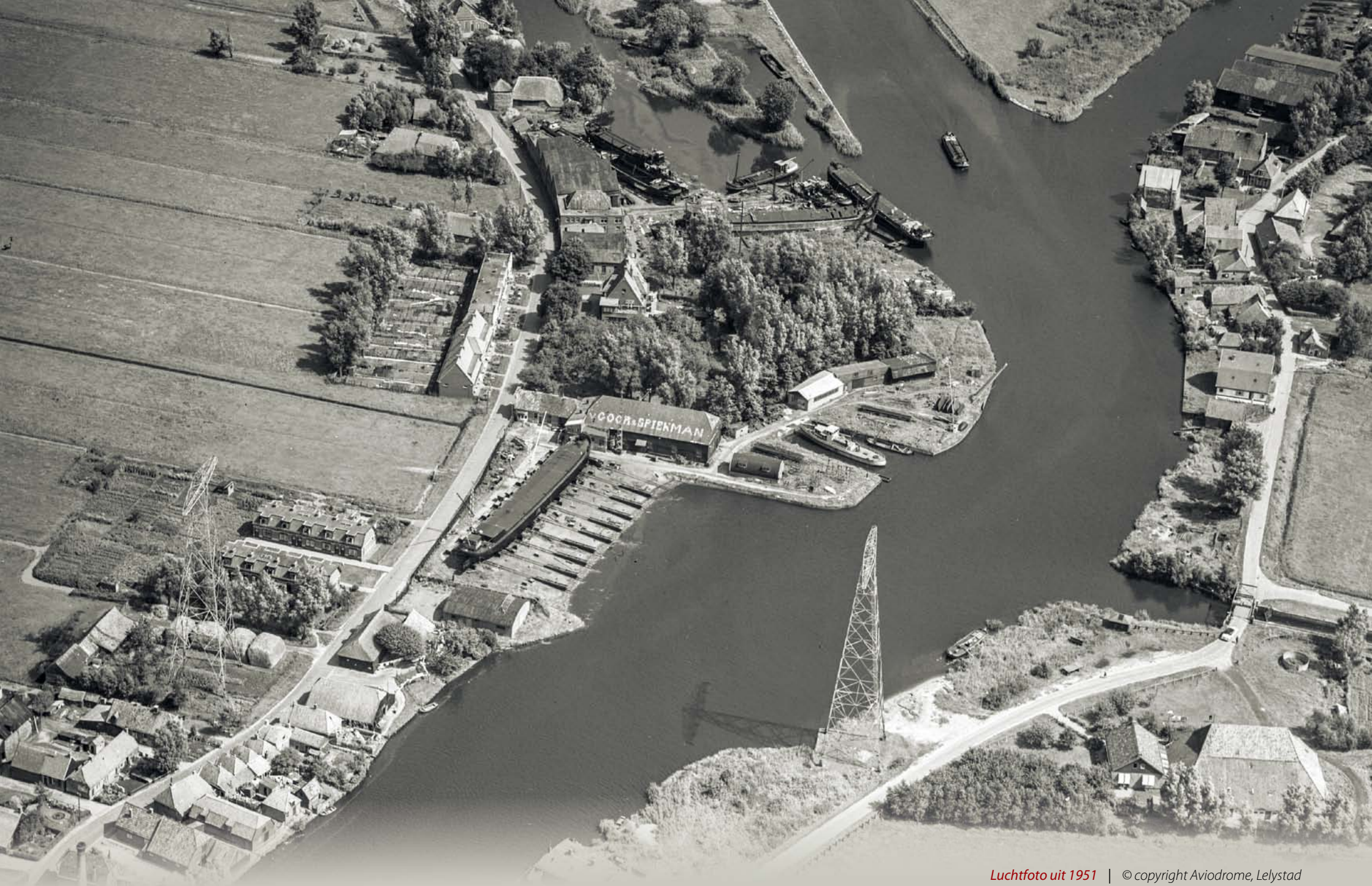
Luchtfoto uit 1951