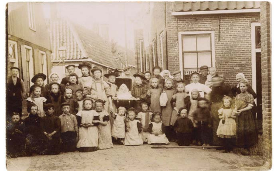
Oude Sluzigers in de Nieuwesluis. Rechts achter deze Sluzigers is nu de ingang van de Turfoverslag

Inmiddels bevat het bestand 15.000 records, met ca. 30.000 namen. Dit jaar hoop ik de verwerking van de begraafboeken en daarmee het bestand Sluzigers af te kunnen ronden.