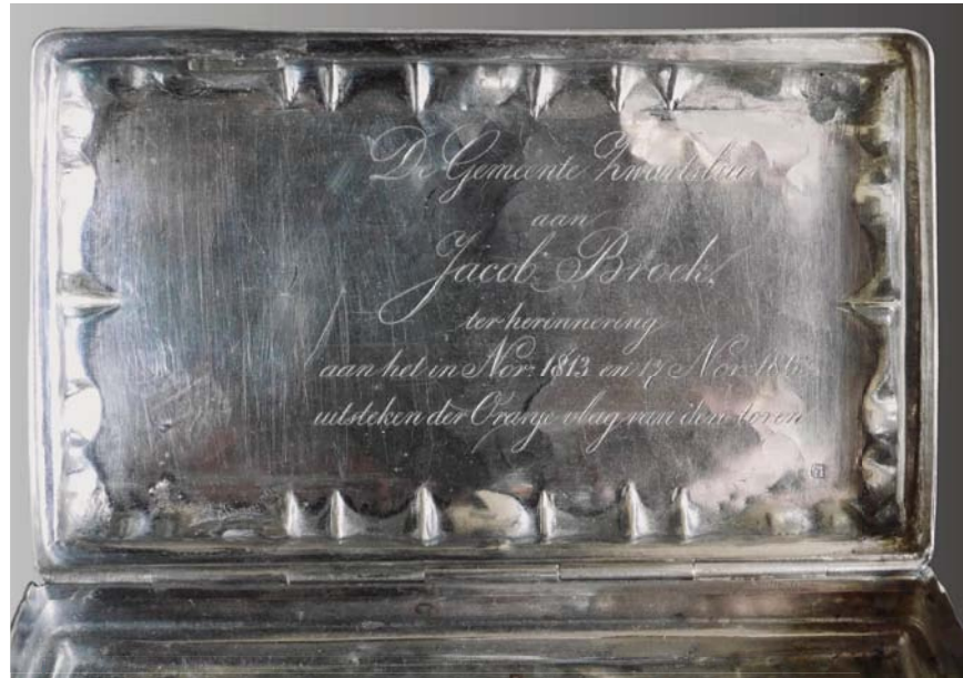
De tabaksdoos met inscriptie

Zijn handen beefden toen hij een pakje onder zijn trui vandaan haalde en uitvouwde. De stok lag voor hem klaar en met zwierige strikken knoopte hij de Oranje vlag eraan vast. Moeizaam zette hij zijn knie op de rand en opende het luik.