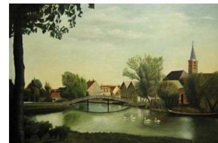
Singelgracht Zwartsluis door Klaas Martinus, 72x48 cm olieverf op paneel, ongeveer 1975