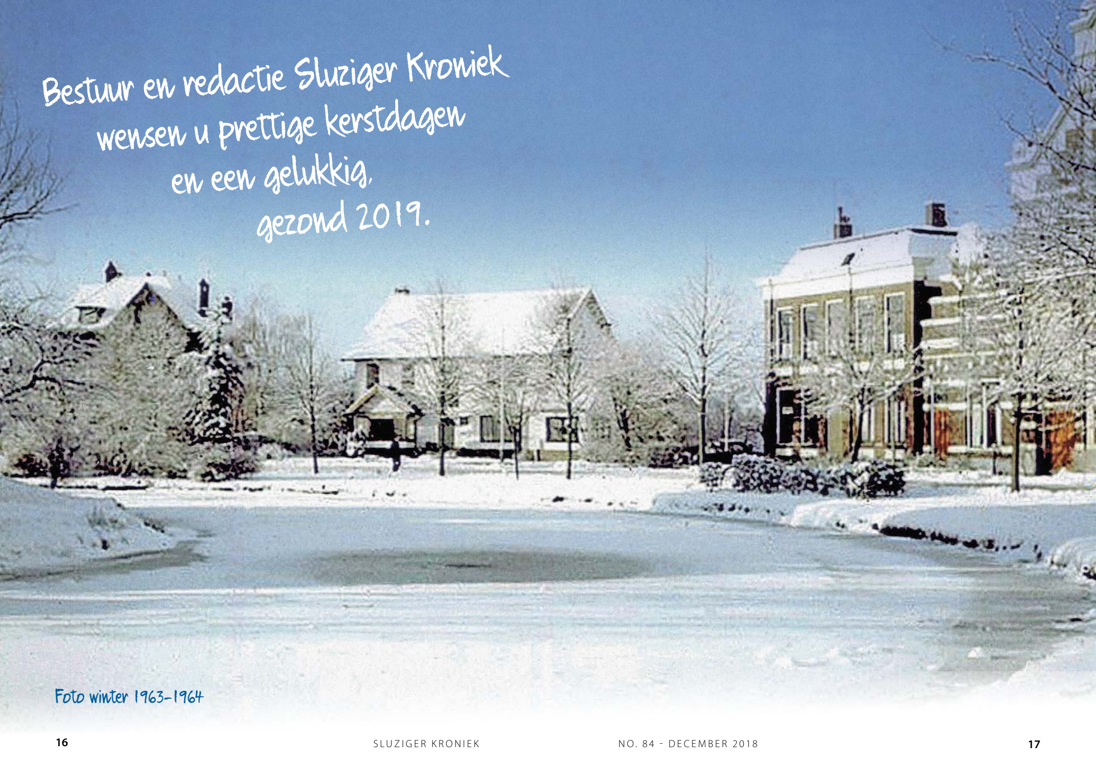
Foto winter 1963-1964

Bestuur en redactie Sluziger Kroniek wensen u prettige kerstdagen en een gelukkig, gezond 2019.