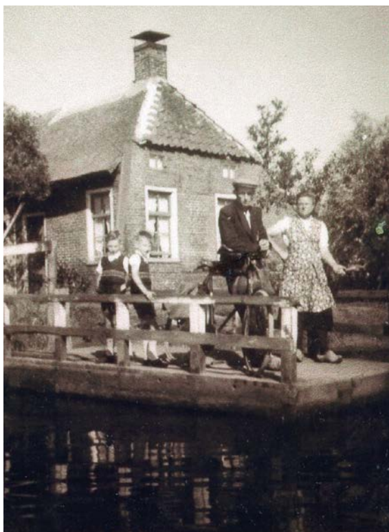
| Met het pontje

Opoe stond 's morgens altijd als eerste op om de kachel en het fornuis op te