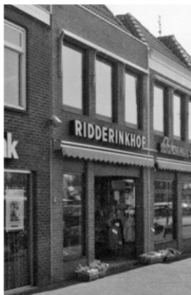
De zaak Ridderinkhof in 1976