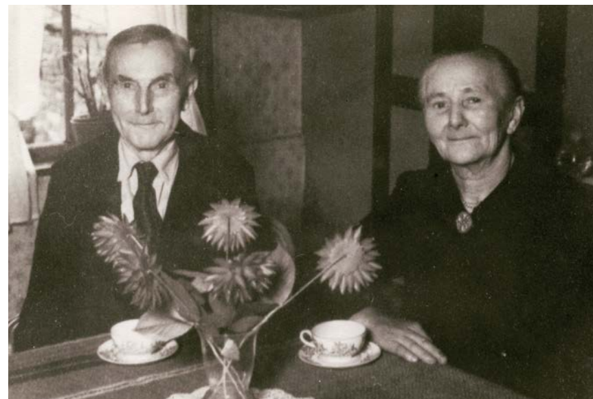
| Opa en opoe Jonkman

Jan pakt een andere foto erbij. 'Behalve bij opoe en opa an de Grachte, brachten we ook veel tijd door bij onze andere grootouders; Roelof met Aole Jonkman.