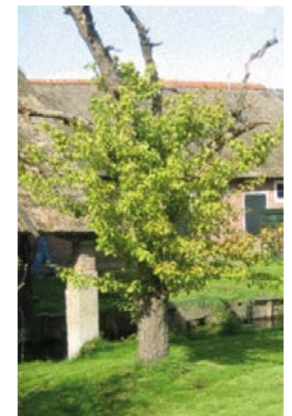
Stoofpeer van Jouk