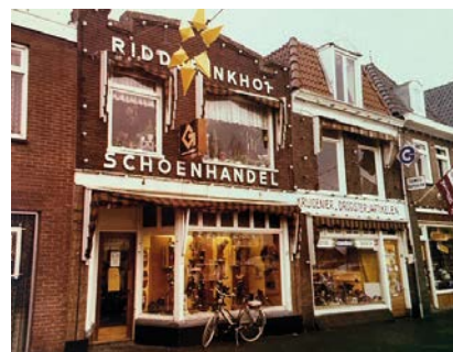
1e verbouwing wordt gevierd

winkel liep Voorwaarts de winkel binnen via de deur aan de Stationsweg en de Kerkstraatdeur weer uit. Binnen een week of 5 was de totale winkel verbouwd! De hele verbouwing verliep heel voorspoedig. Ondertussen hielden ze een drastische opruiming van alle schoenen die ze zelf niet hadden ingekocht. Vanaf het eerste moment dat Jan met de zaak begon in Zwartsluis voelde hij de 'gunfactor' van de mensen uit Zwartsluis en ook uit de omgeving: in de winkel