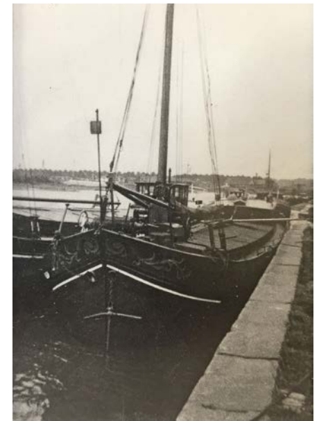
Het schip de 'Orion'

Zij vertelt verder: "Onder onze vensterbanken had je poortjes met kastjes die onder het gangboord zaten. Met buitenwater werd de was in een kuip (is een houten ton) gedaan met een stamper. Je had een fornuis met 2 gaten waaronder vuur uit turf brandde. Altijd stond er een zakkeltje met water op 't vuur. Aan de onderkant van zo'n keteltje zat een zogenaamde zak waardoor de ketel niet verschuiven kon door het golvende vaarwater. Aan boord was een vat met 200 liter drinkwater, waar je zuinig mee was. Elk kind werd in een zinken teil met hetzelfde (buiten)water gewassen. Dat kon toen nog." Het gezin Troost was 4 kinderen rijk: 3 jongens en Marie was de jongste en enig meisje. Zij herinnert zich een voorval in hun roefje nog goed: "Wij zaten als vier kinderen op het bankje in de roef. Onder de tafel stond de turfmand waar ik per ongeluk een keer tegen aanschopte waardoor de mand omviel. Wat kreeg ik op m'n kop hiervoor!"