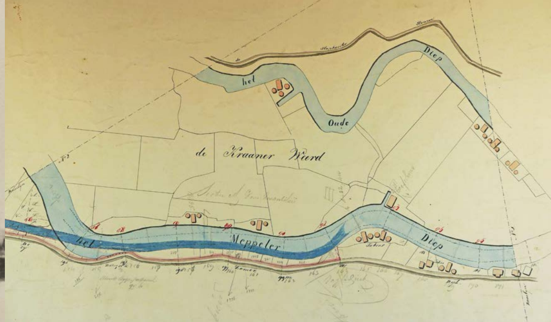
Alleen al op de Kranerweerd stonden vroeger ca. 20 kalkovens