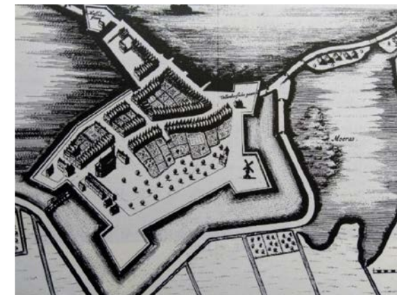
Plattegrond Swartsluis, kaart van Blaeu, 1649

In het begin van de 20e eeuw was er in de richting van Hasselt naar Zwartsluis ook nog een tolhek. Een tolhek is een hek dat de weg versperde, zodat men tol kon vragen voor de doortocht. De buurtschappen Zwartewatersklooster en De Velde behoorden tot lang na de Reformatie tot de stad Hasselt. De Reformatie was het zestiende-eeuwse schisma binnen het westerse christendom, dat ingezet werd door Maarten Luther, Johannes Calvijn en andere vroege protestanten en duurde van 1517 – 1648. Het klooster daar heette officieel Het Zwartewatersklooster van Hasselt. Dit blijkt trouwens ook uit de plaats waar het voormalige tolhek gestaan heeft. Het Zwartewatersklooster is trouwens gesticht in het jaar 1233 door bisschop Willebrand van Utrecht. Het mocht 20 zusters opnemen die zich aan strenge regels moesten onderwerpen. Deze strenge regels zijn de aanleiding geweest dat er tweemaal een uittocht heeft plaatsgevonden, eenmaal naar een klooster in Hattem en eenmaal naar een klooster in Raalte. Deze laatste groep ging echter in 1393 weer terug naar het Zwartewatersklooster. Na de Reformatie kwamen de bezittingen van dit klooster in handen van de Ridderschap.