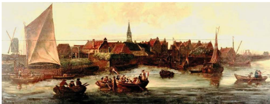
Vesting Swartsluis, geschilderd door Ysaac Glas, 1685

Zwartsluis was in de 80-jarige oorlog geheel aangelegd als vesting. Doordat in die tijd Zwartsluis geheel door water was omgeven, lag deze vesting behoorlijk gunstig. Namen herinneren nog aan die tijd. Het gedeelte van Zwartsluis dat binnen de gracht lag heette De Schans en het gedeelte naast de grote kolksluis werd Achter de Wal genoemd. Achter hotel Roskam was voor de komst van de tram in 1914 nog een stuk muur zichtbaar. Dit was een overblijfsel van een gedeelte dat Bolwerk genoemd werd en geheel door een gracht