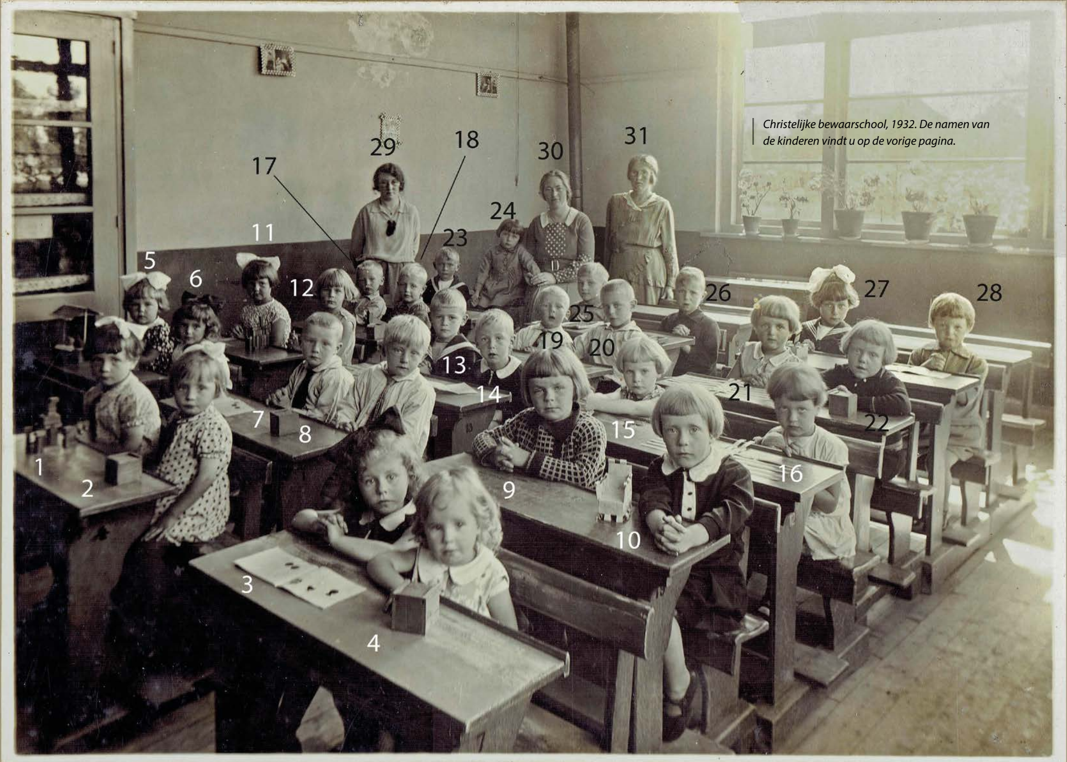
Christelijke bewaarschool, 1932. De namen van de kinderen vindt u op de vorige pagina.