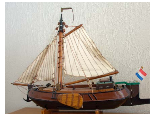
Scheepsmodel van de Tjalk de Hoop