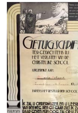
Getuigschrift uit 1946