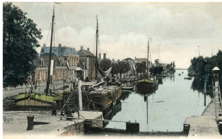
Het Groot Lageland

Ongeveer waar nu de open ruimte is, stond vroeger een vluchtkerkje van de Doopsgezinde Gemeente. Het was gebouwd in 1692. Het poortje dat toegang verleende droeg het opschrift: 'Door dees enge poort, Gaat men tot des