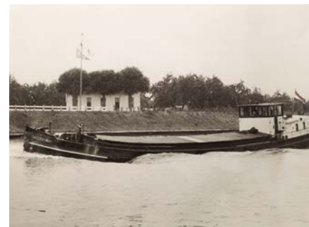
Het schip de 'Onderneming'