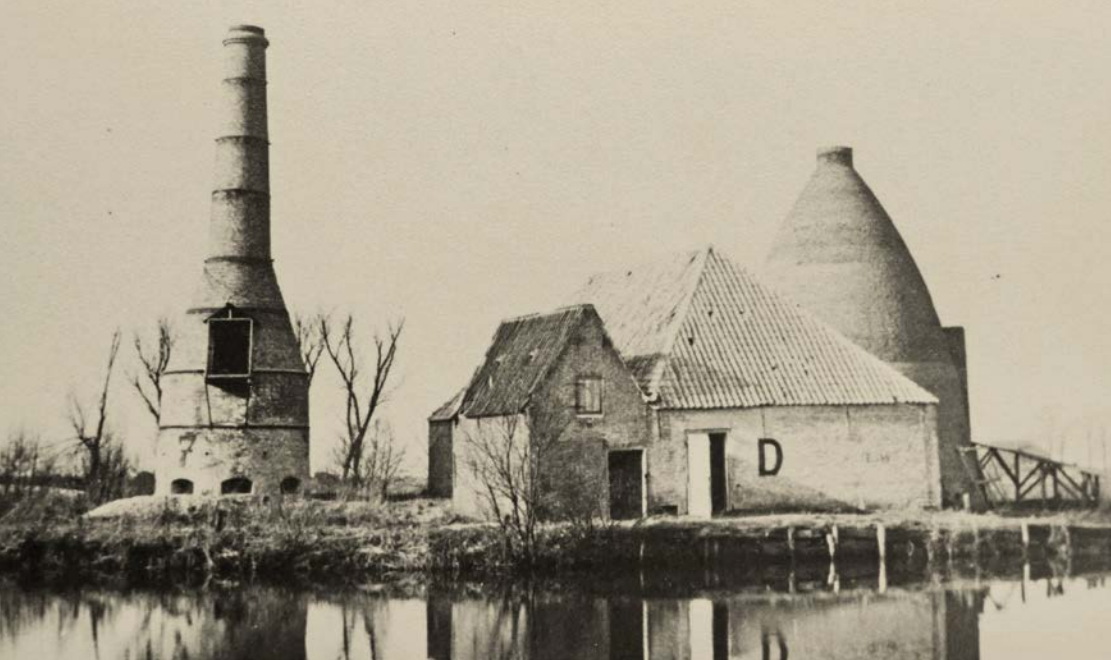
Kalkovens op de Kranerweerd