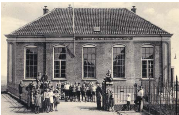
L.F. Duynmaer van Twistschool