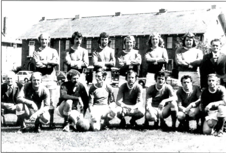
Seizoen 1973 - 1974 het derde elftal kampioen: