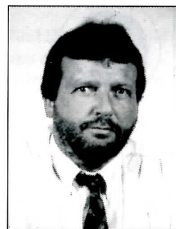
Namens de jubileumcommissie

Onder dankzegging aan de adverteerders, die deze jubileum-uitgave mede hebben mogelijk gemaakt, wensen wij u veel lees- en kijkplezier.