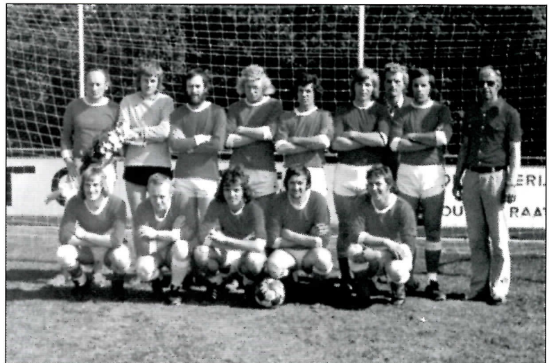
Een vriendenteam (DESZ 4)